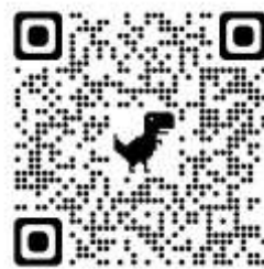
◆ 新北市立圖書館電子資源管理系統介面